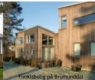
Funkisbolig på Brumunddal

Natre Vinduer AS er en landsdekkende produsent av vinduer, balkongdører og heve-/skyvedører. Vi har fire fabrikker og seks salgsavdelinger fra Larvik i sør til Bergen i vest og Meråker i nord. Kvalitet, design, service og praktiske løsninger legger vi stor vekt på. Over 50 års erfaring har gjort Natre til en ledende aktør i det norske markedet.