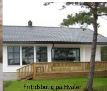
Fritidsbolig på Hvaler